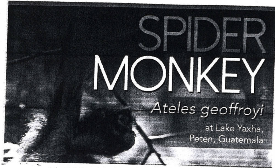
Fig. 7: Material educativo y gráfico de FLAAR.