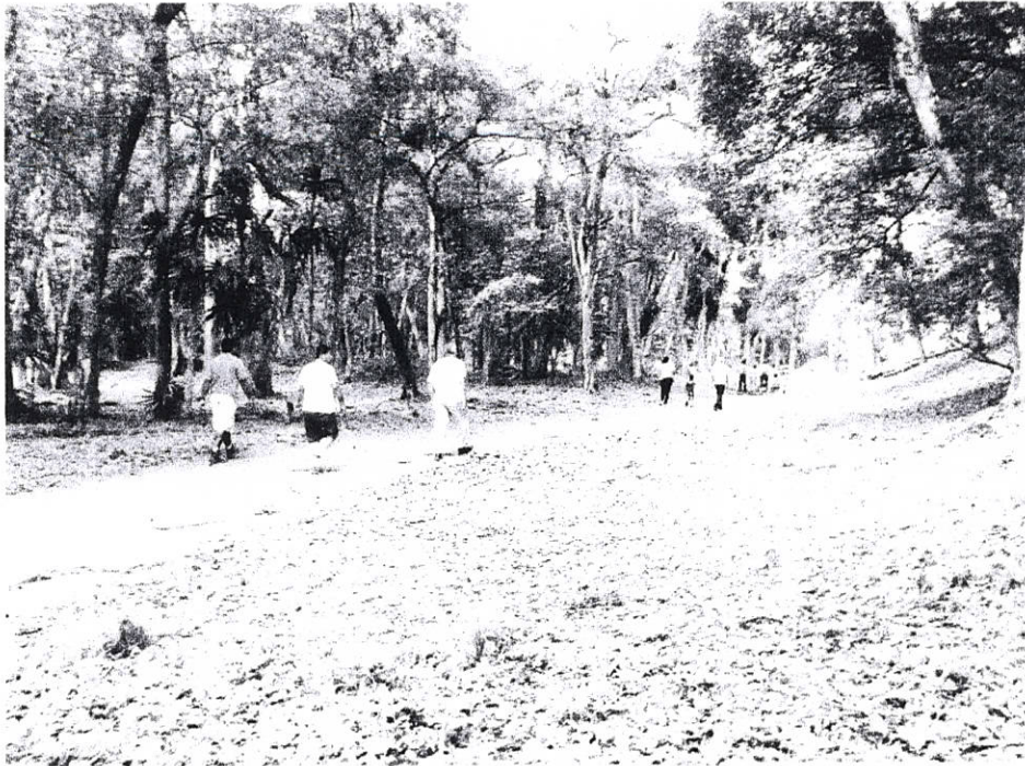
Fig.3: Grupo de visitantes en área de acrópolis sur y calzada del lago.

Se recorre el área de uso público para observar las actividades de visita y el comportamiento de vigilantes y trabajo del grupo de vigilancia.